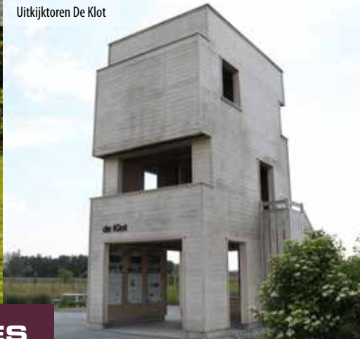
Uitkijktoren De Klot

Ontdek dit uniek natuureservaat met rietvelden, broekbosjes en natte weilanden. Het rietland De Maatjes behelst zowel Nieuwmoer en Wuustwezel als Nederlands grondgebied. Zeldzame riet- en weidevogels hebben er hun broedplaats. Stap ook zeker binnen bij de uitkijktoren 'De Klot'. Hier kom je ook meer te weten over de geschiedenis van de Turf, die zeer kenmerkend is voor deze regio.