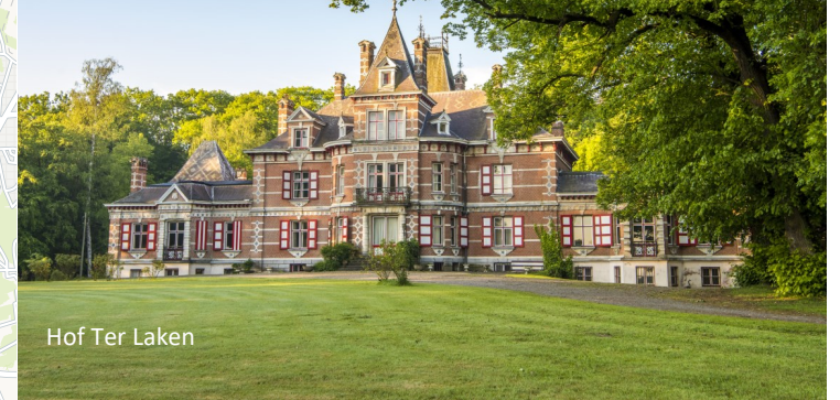
Hof Ter Laken

Deze route leidt je door de Netevallei langs enkele mooie kastelen. Vertrekken doen we aan het Hof Ter Laken in Booischot. Behalve dit domein zijn geen van de andere kastelen toegankelijk.