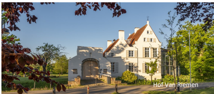
Hof Van Riemen

Het Hof van Riemen is het oudste burgerlijke gebouw in Heist. De slotgracht rond het hof wijst op het voormalig militair karakter. Het hof, de poort en de brug zijn beschermd als monument. Het mooie, witte hof van plaisantie met slotgracht is momenteel locatie voor feesten en meetings.