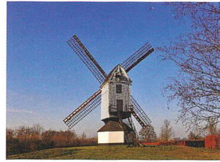
5 Een houten korenwindmolen: 1789.