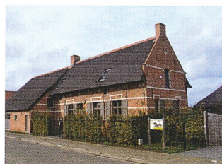
6 Afspanning "De Kroon", 17 de eeuw.