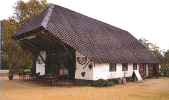
3 Schaapstal, Bouwelhoeve.