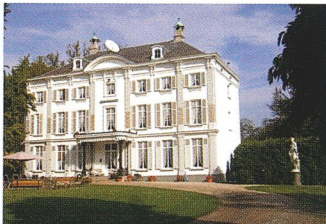
2 Kasteel "Bouwelhof", huidig uitzicht circa 1820.