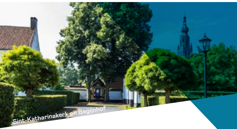
Sint-Katharinakerk en Begijnhof